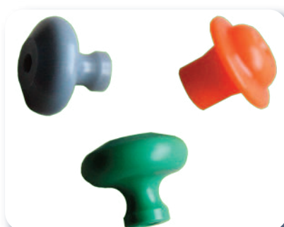
Galets de sertissage