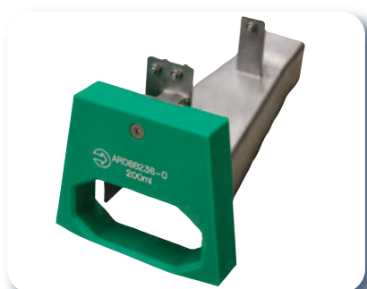
Orienteur de flacons