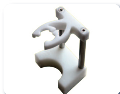
Centreur avec pince