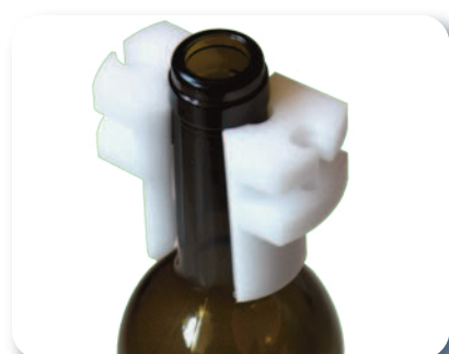
Pinces au goulot