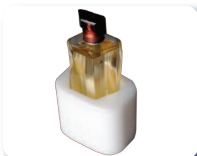
Godets porte-produit (pucks)