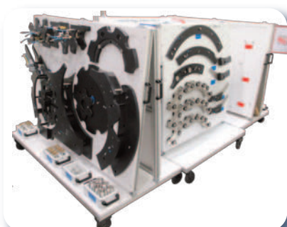
Panneaux de rangement «5S»