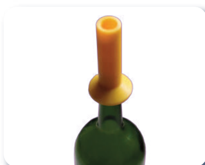
Tulipe de pression pour étiqueteuse