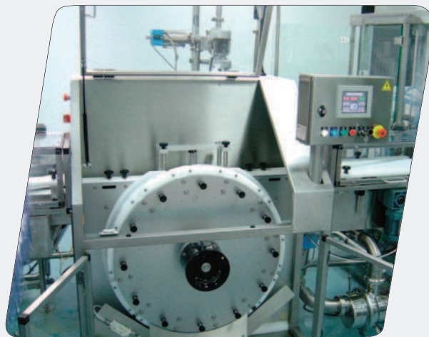
Souffleuses Coris pour lignes de conditionnement