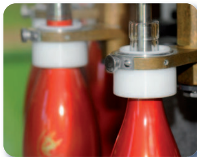
Cloches de soutireuse