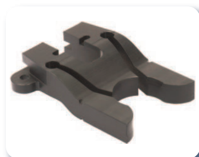
Pinces au corps