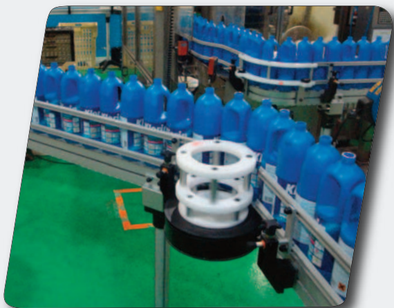
Convoyage de flacons, bouteilles