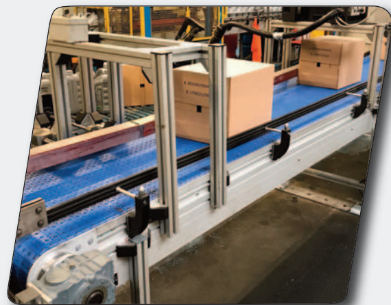
Convoyage de cartons