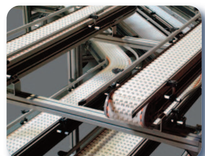
Tapis modulaires et convoyeurs