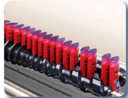
Vis de manipulation