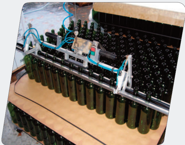
Pinces à dépaletiser