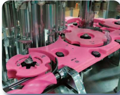
Vis à pas variable, outillages