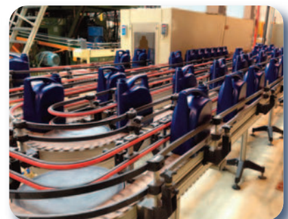
Convoyeurs modulaires à chaîne