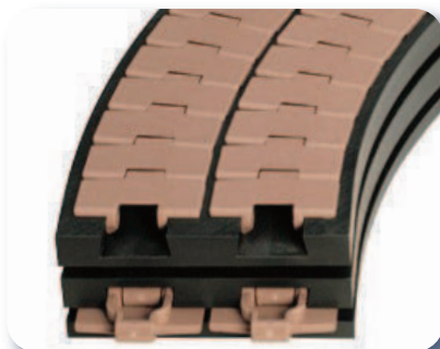
Profils de glissement