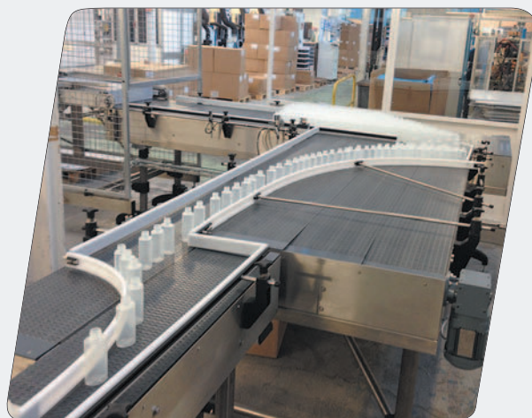
Tables de chargement, d'accumulation Coris