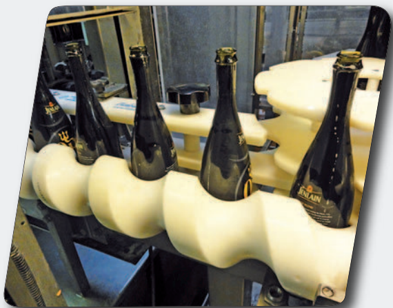
Vis et outillages