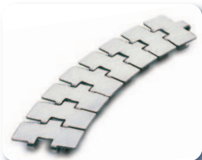
Chaines de convoyage