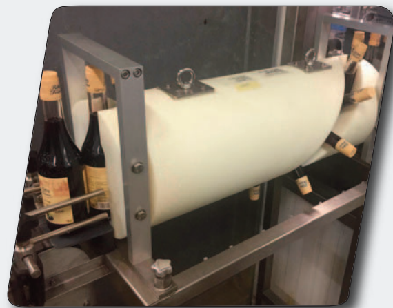
Manchons de retournement