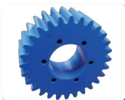
Pignons modules droits de 0,5 à 16 mm