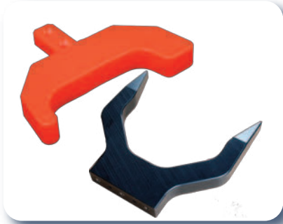
Guides produits, fourchettes